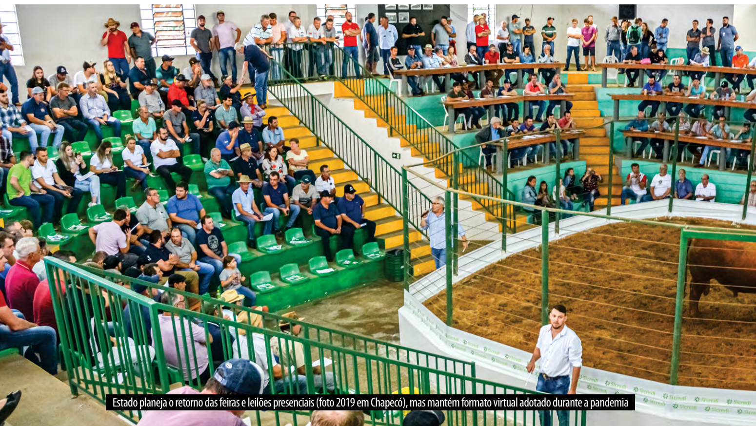
Estado planeja o retorno das feiras e leilões presenciais (foto 2019 em Chapecó), mas mantém formato virtual adotado durante a pandemia