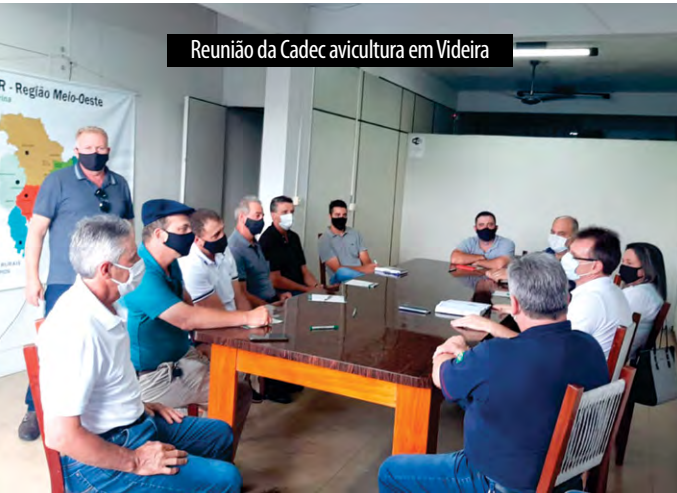
Reunião da Cadec avicultura em Videira