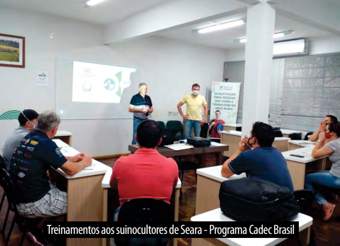
Treinamentos aos suinocultores de Seara - Programa Cadec Brasil