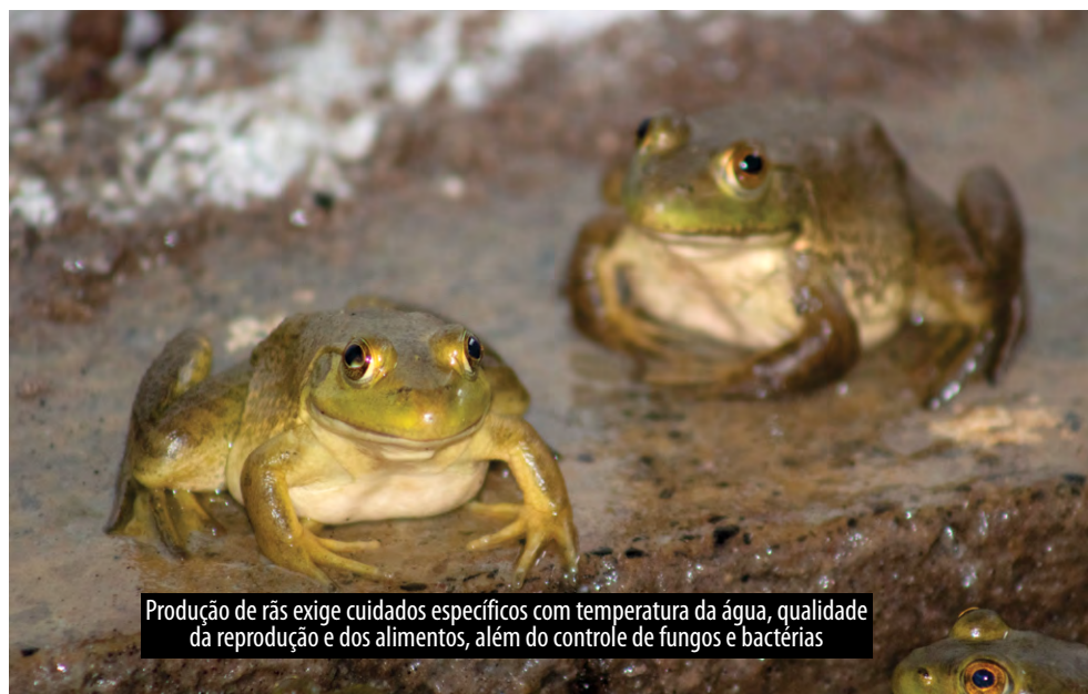
Produção de rãs exige cuidados específicos com temperatura da água, qualidade da reprodução e dos alimentos, além do controle de fungos e bactérias