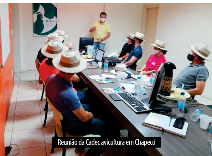
Reunião da Cadec avicultura em Chapecó