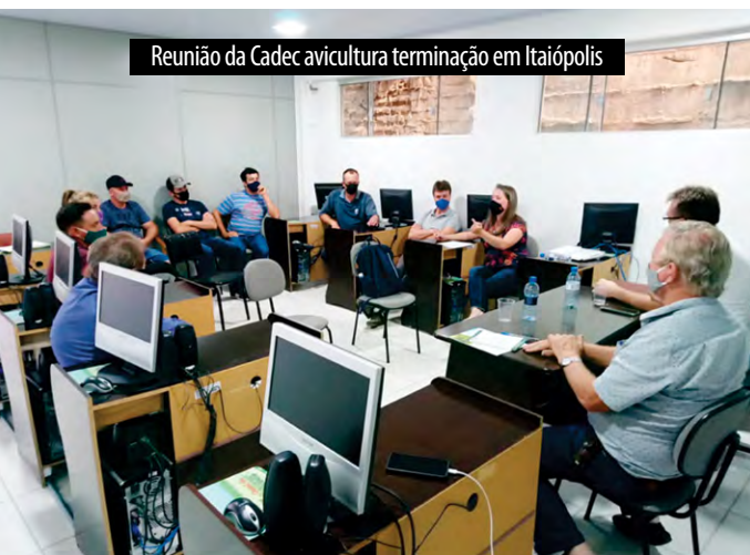
Reunião da Cadec avicultura terminação em Itaiópolis