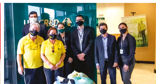
Entrega das doações da agência Laguna