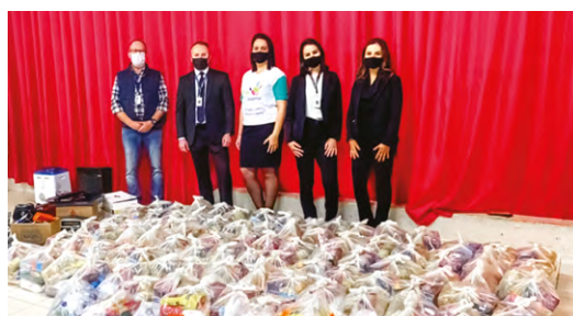
Mantimentos arrecadados pela agência Tubarão