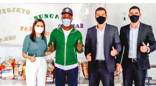
Arrecadações da agência Criciúma - Centro

Manter um ambiente corporativo saudável é um dos compromissos do sistema cooperativista, por isso, são realizadas pesquisas constantes para medir o clima organizacional. No ano passado, foi aplicada uma pesquisa que investigou as cinco dimensões do engajamento de acordo com a metodologia da Decisionwise, MAGIC que são: Meaning (Significado), Autonomy (Autonomia), Growth (Crescimento), Impact (Impacto) e Connection (Conexão). Por meio de questionamento foi medido o nível de engajamento e a aderência dos colaboradores da Unicred Centro-Sul à cultura organizacional. O resultado apontou que 95% dos colaboradores sentem-se comprometidos e engajados com seu trabalho e com a cooperativa.